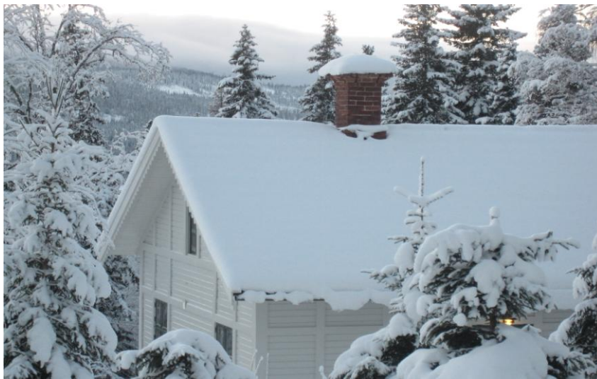
Åre i vinterskrud

Konferensens avslutning och uppbrott gav mersmak. Åre är (kanske vid sidan av årsmötet) föreningens mest spännande träffpunkt. Alla hoppas på ett snart återseende – i en förhoppning om att fler kollegor och medarbetare kan delta.