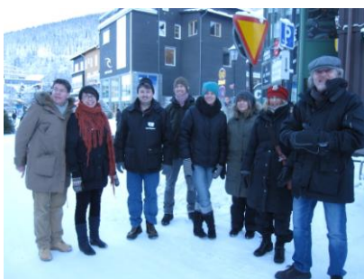
Några av deltagarna på väg upp

Formen för det årliga erfarenhetsutbytet i Åre är att deltagarna berättar om erfarenheter från aktuella projekt och verksamheter kring film och andra medier i skolan. Dessa avrapporteringar ligger på ett naturligt sätt till grund för längre reflekterande samtal. Det sker både på schemalagd tid, där samtalen lyhört modereras av konferensansvarige Stefan Ek från Filmpool Jämtland, men också i informella samtal kring måltider och kaffekoppar eller i en (av konferensansvarige anbefalld obligatorisk) promenad på Åreskutan.