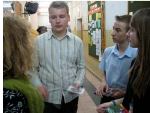
Tre elever i årskurs 9

En lärare tjänar 1000 – 2000 zloty per månad efter skatt. Det motsvarar 3000 – 6000 kr/månad. Att hyra en lägenhet kostar ca 400 zloty/månad (1200 kr).