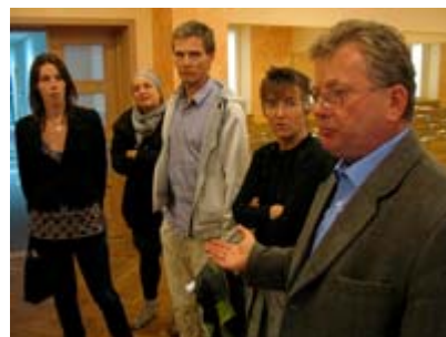
I den nyrenoverade balettsalen