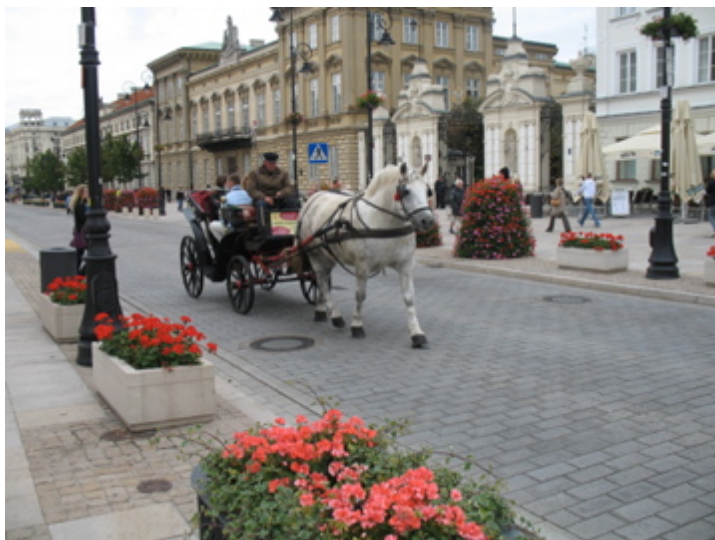
Warszawa – Krakowskie Przedmieście