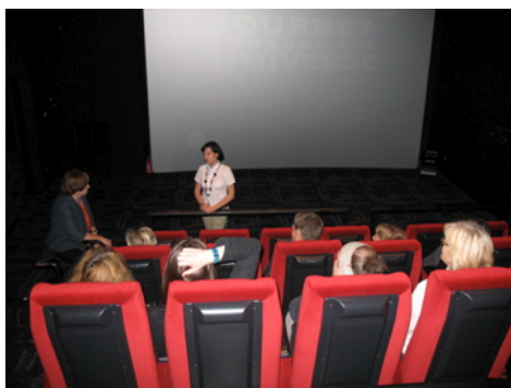
3D-, eller egentligen 4D-salen.

Vad är Cinema Park? Det är en ny multimedial pedagogisk plattform där man följer ett program genom sex olika salar: interaktionssalen, rörelsesalen, musiksalen, 3D-salen, fantasialen och inspirationssalen. Man utgår från ett tema, till exempel "Djurens rike" eller "Allt om människan", och får uppleva detta ämne utifrån olika aspekter och synvinklar beroende på vilken sal man befinner sig i. Den salen så kallade 3D-salen var egentligen fyrdimensionell – Tekniska museet i Stockholm inspirerades faktiskt av den vid byggandet av sin Cino 4 -biograf.