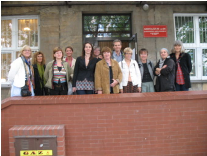
Filmpedagogerna framför Kieślowskiskolan