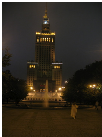
Kulturpalatset by night

Vi hamnade på det fyrstjärniga hotellet Intercontinental mitt i Warszawa, och från de övre planen, 30–40 våningar upp, bredde Warszawas panorama ut sig. Den magnifika spiran med den nyinsatta Big Ben-liknande klockan på Kulturpalatset, gåvan från Stalin till Polens folk, syntes precis utanför fönstren. Mer centralt kunde man inte vara. Förutom undertecknad, var alla där för första gången. Det var en tacksam uppgift för mig att visa runt gruppen och presentera en stad de aldrig hade besökt.